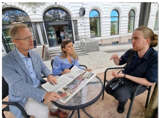
Møte med stortingsrepresentantene Johnsen og Molberg.

I midten av juni tok våre lokale stortingsrepresentanter Tor Andre Johnsen (Frp) og Anna Molberg (H) initiativ, og sendte hvert sitt skriftlige spørsmål til justis- og beredskapsministeren, og barne- og familieministeren (som har ansvar for forbrukersaker).