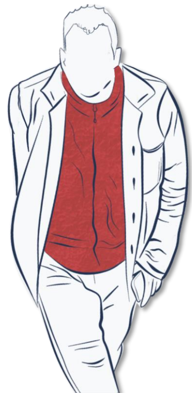
Amedia Kreativ utformet grafikk.

Vi ønsket at saken skulle skille seg litt ut fra vanlige feature-saker, og sånn sett reflektere at det lå mye arbeid bak. Vi var inspirert av hvordan Nordlys-artikkelen Skredet var utformet, og hadde håpet på en lignende løsning.