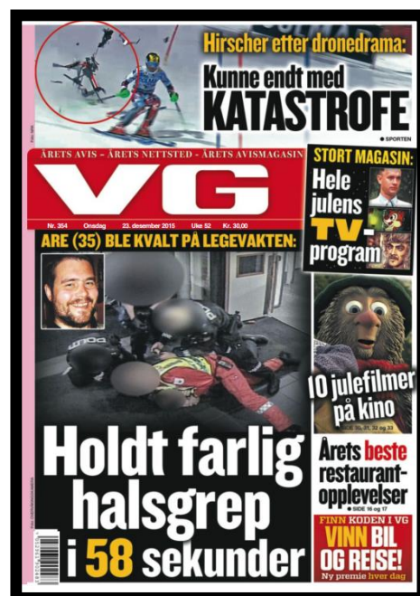
VG 23. desember 2015

Saken har stor betydning for pressens mulighet til å kunne utøve sin funksjon som samfunnets vaktbikkje; å etterprøve maktbruken ved den dødelige pågripelsen. (...) NRK fortjener ros for atter å ha bragt et viktig demokratisk spørsmål til topps i domstolene.