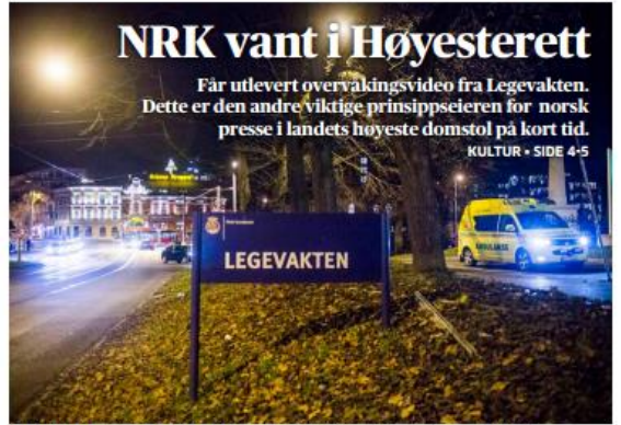
Høyesterett har fått dom om at NRK må få tilgang til en overvåkingsvideo fra Oslo legevakt der en psykiatrisk pasient blir kvalt til døde av en ambulansesjef.