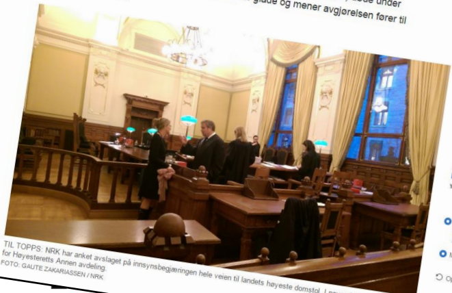
TIL TOPPS: NRK har anket avslaget på innsynsbegjæringen for Høyesteretts Annen avdeling.