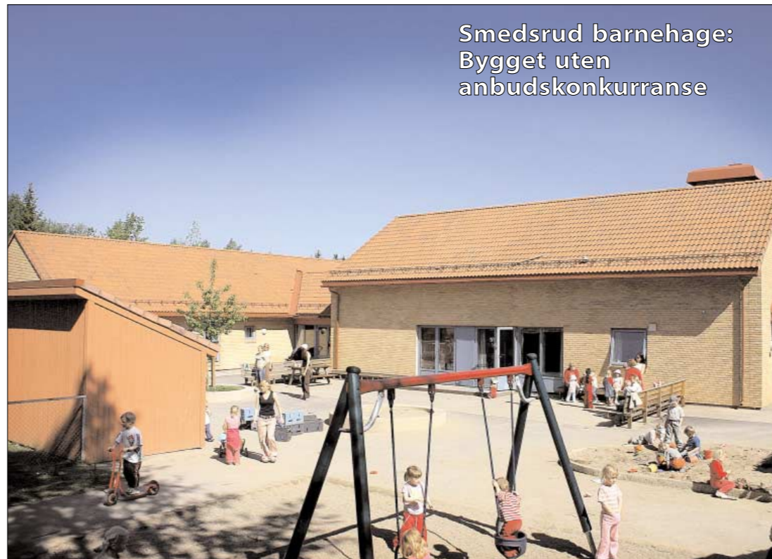
Smedsrud barnehage: Bygget uten anbudskonkurranse