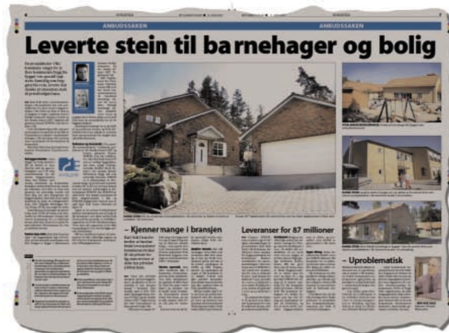
Faksimile fra Østlandets Blad 11, juni 2005