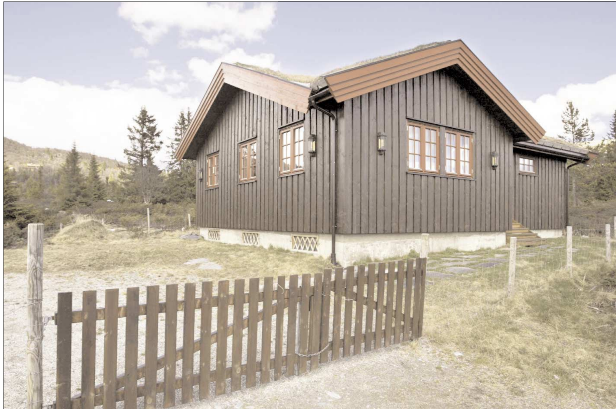
HYTEHJELP: Virksomhetslederen i Ski kommune fikk hjelp til å sette opp denne hytta av firmaer som samtidig

var engasjert til å gjøre jobber i Ski kommune.