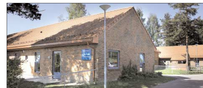
DANSK STEIN: Øvre Hebekk barnehage er bygget i stein fra samme firma som steinen prosjektlederen i Ski kommune brukte i sin privatbolig.