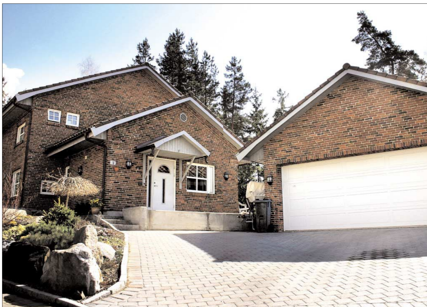
DANSK STEIN: Slik ser privatboligen til prosjektlederen i Ski kommune ut. Steinen er levert av firmaet SHT Teglelementer AS: samme firma som har levert teglelementer til flere store prosjekter i Ski kommune.

ØB har imidlertid funnet all informasjon via søk i offentlige registre og fått utlevert dokumenter med hjemmel i Offentlighetsloven.