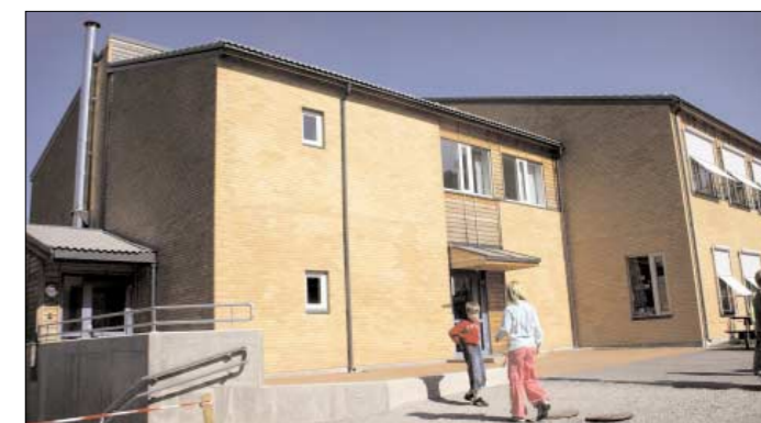
DANSK STEIN: Langhus skole er bygget om, og steinen er fra samme firma som steinen prosjektlederen i Ski kommune brukte i sitt privatbushus.