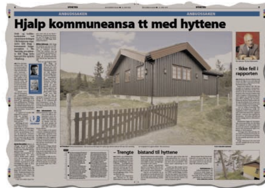
Faksimile fra Østlandets Blad 13, juni 2005