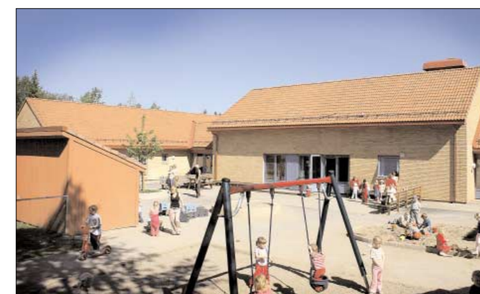
UTEN ANBUSSKONKURRANSE: Smedsrud barnehage ble bygget uten anbudskonkurranse.

Politikerne har på sin side bevilget flere titalls millioner til prosjekter der kommuneadministrasjonen har tydd til «lettvinde løsninger».