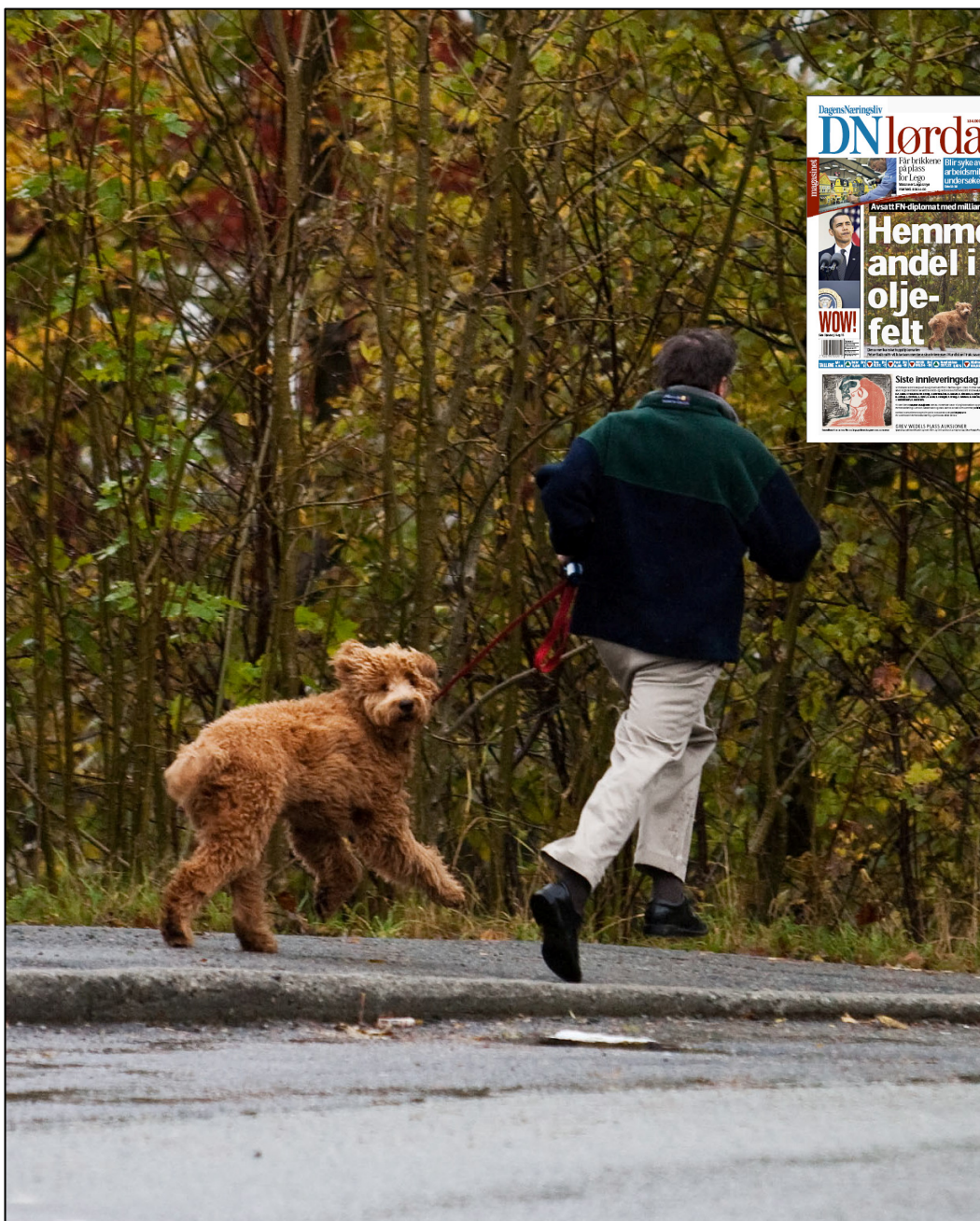
På flukt fra sannheten: Toppdiplomat Peter Galbraith og hund i fullt firsprang etter å ha blitt konfrontert med hemmelige eierinteresser i et kurdisk oljefelt.

En metoderapport om DNO-sakene Publisert i Dagens Næringsliv høsten 2009