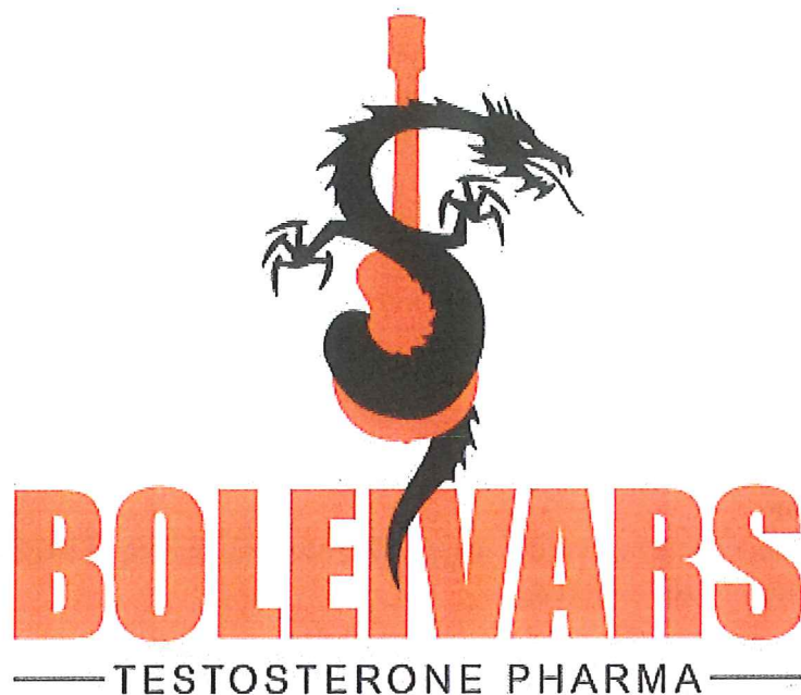
Fig. Logo for dopingprosjektets fiktive undergrunnsmerke.

Jeg søkte på nettet etter leverandører av råstoff/pulver til ulike anabole steroider. I tillegg fant jeg enkelt leverandører av ulikt nødvendig utstyr, som pillepresser, hetteglass og etiketter. Jeg konsentrerte meg om leverandører fra Kina, som skulle være mest vanlige, ifølge mine kilder. Disse nokså vilkårlige e-postene var sendt fra en ordinær hotmail.adresse og på enkel gymnasengelsk. Jeg sendte de fleste av mailene 6.april og forklarte at jeg ønsket å starte produksjon i Norge og at det ikke er tillatt å importere anabole steroider.