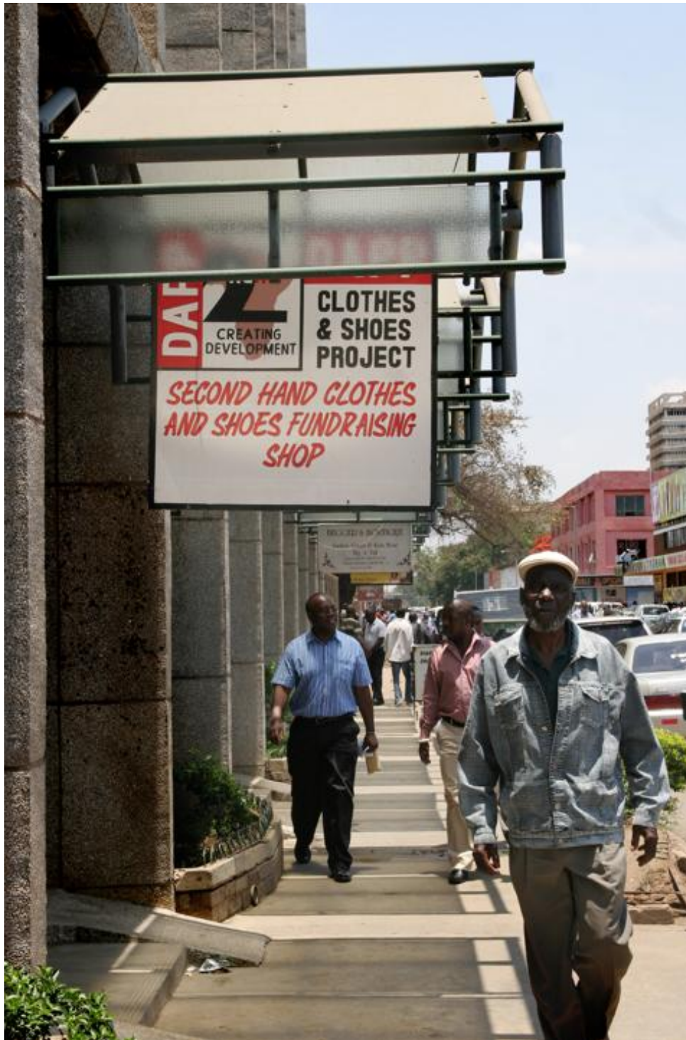
I Zambia er UFF (DAPP) først og fremst kjent som en butikkjede, ikke som bistandsorganisasjon.

Lindekleiv tar også kontakt med den norske ambassaden i Zambia. Både ambassaden og Kirkens Nødhjelp forteller at de hadde vært i kontakt med representanter fra UFF som ønsker relasjoner, men at dette er blitt avvist. Likeledes tar hun kontakt med aktuelle bistandsorganisasjoner, og ber om møter med dem. Hun får også assistanse av kontakter i Lusaka til å sette opp avtaler.