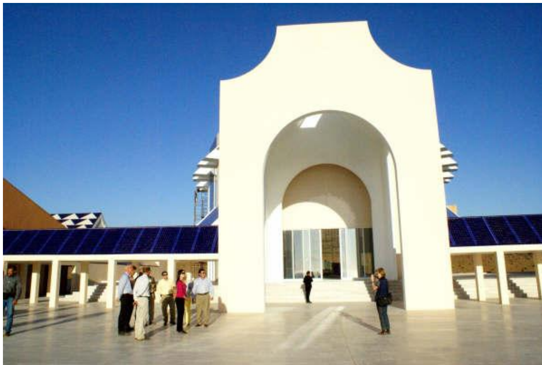
TG Pacifico, eller «Lærergruppens hjem» får også besøk fra Norge. Her fra åpningen av luksuskomplekset i Mexico.