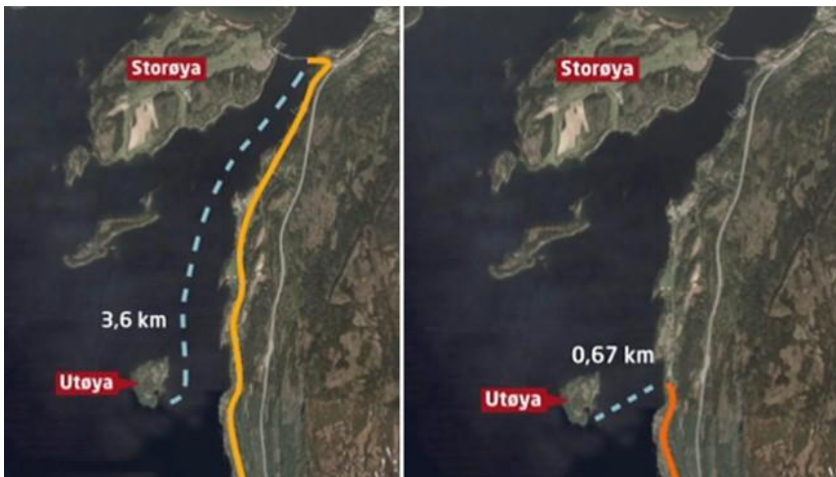
Figur 2: Opplysningene fra kilder om politiets rute og fra egne beregninger i kartverktøy ga slike forklarende grafiske elementer både til tv-presentasjon og til nettartikler.