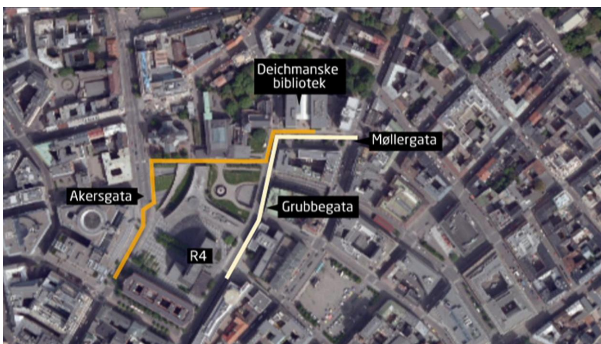
Figur 3: Opplysninger fra øyenvitnet gjorde det mulig å kartlegge gjerningsmannens bevegelser bort fra bombebilen (hvit strek).

Vi snakket sammen flere ganger i dagene som fulgte, og utviklet en hyggelig tone. Vi gikk gjennom i detalj hans observasjoner. Observasjoner som var overraskende nøyaktige, han hadde vært svært oppmerksom i denne situasjonen.