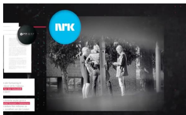
BCC tok i skjul bilder av NRKs medarbeidere til bruk i sin egen dokumentar.

Gjennom nye kilder utenfor BCC fant vi allerede våren 2020 selv fram til intern dokumentasjon fra PsyGroup relatert til BCC. Vi fikk også tak i et forslag til en kontrakt fra