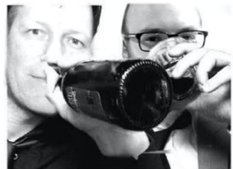
Manipulert bilde av NRKs journalist.