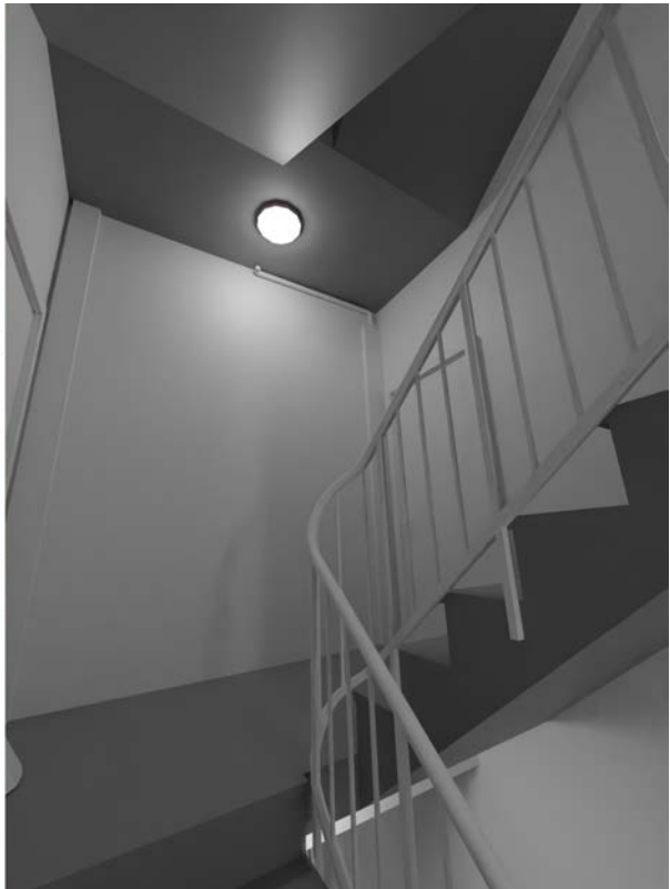
Sammenligning av referansebilder og 3D-modellen