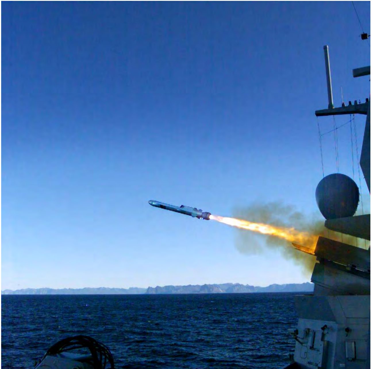
ETTERTRAKTET: Missilet NSM, som lages av Kongsberg, var ettertraktet av USA – også for videresalg.