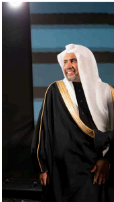
Verld League fekk Brøyggerprisen i 2021, saman med to andre.