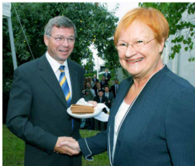
STATSIEIE. Då Igeil Magre Bondevik opna Oslo-senteret i 2008 fekk han med seg Finlands tidlegare president Tarja Halonen i styret.