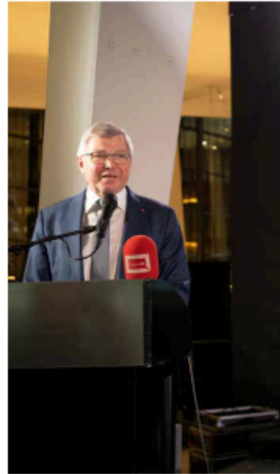
PRIS: Generalsekretær Mohammad Bin Abdulkarim Al-Issa i Muslim World League talte på arrangementet.

I intervju med Dagbladet har Bondevik sagt at MWL er ein uavhengig og sjølvstyrt organisasjon som ikkje har formelle band til dei autoritære, saudiarabiske regjeringane, og heller ikkje får økonomisk støtte frå dei same regjeringane.