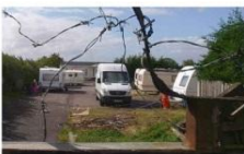
RAIDET: Etter en lang etterforsking raidet tungt bevapnet britisk politi denne campingplassen Green Acres i Bedfordshire i september 2011. Der fant de slaver som bodde under svært kummerlige forhold.