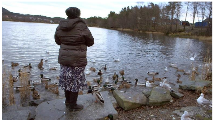
Vi brukte mye tid på å gjøre intervjuobjektene trygge.

Svært få rundt dem vet hva de har vært igjennom. Kvinnene bærer på mye skam knyttet til deres fortid, og de er veldig redde for å bli gjenkjent i nærområdene sine. Kvinnene risikerte mye dersom de stilte opp på TV. Det var helt avgjørende at de fikk tillit til oss.